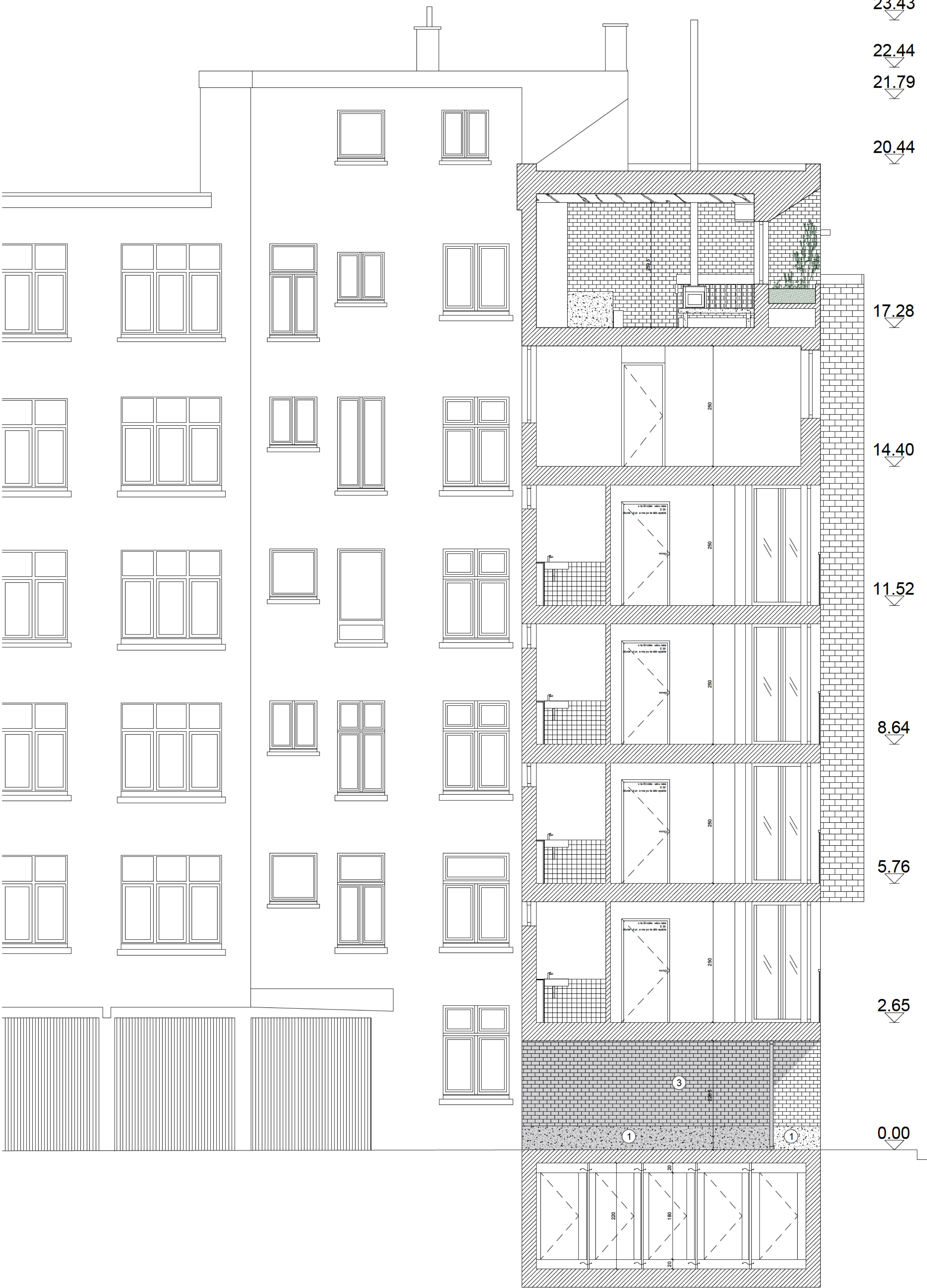
Coupe transversale 2 1/50